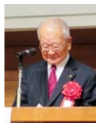
税連協 牛込会長 祝辞