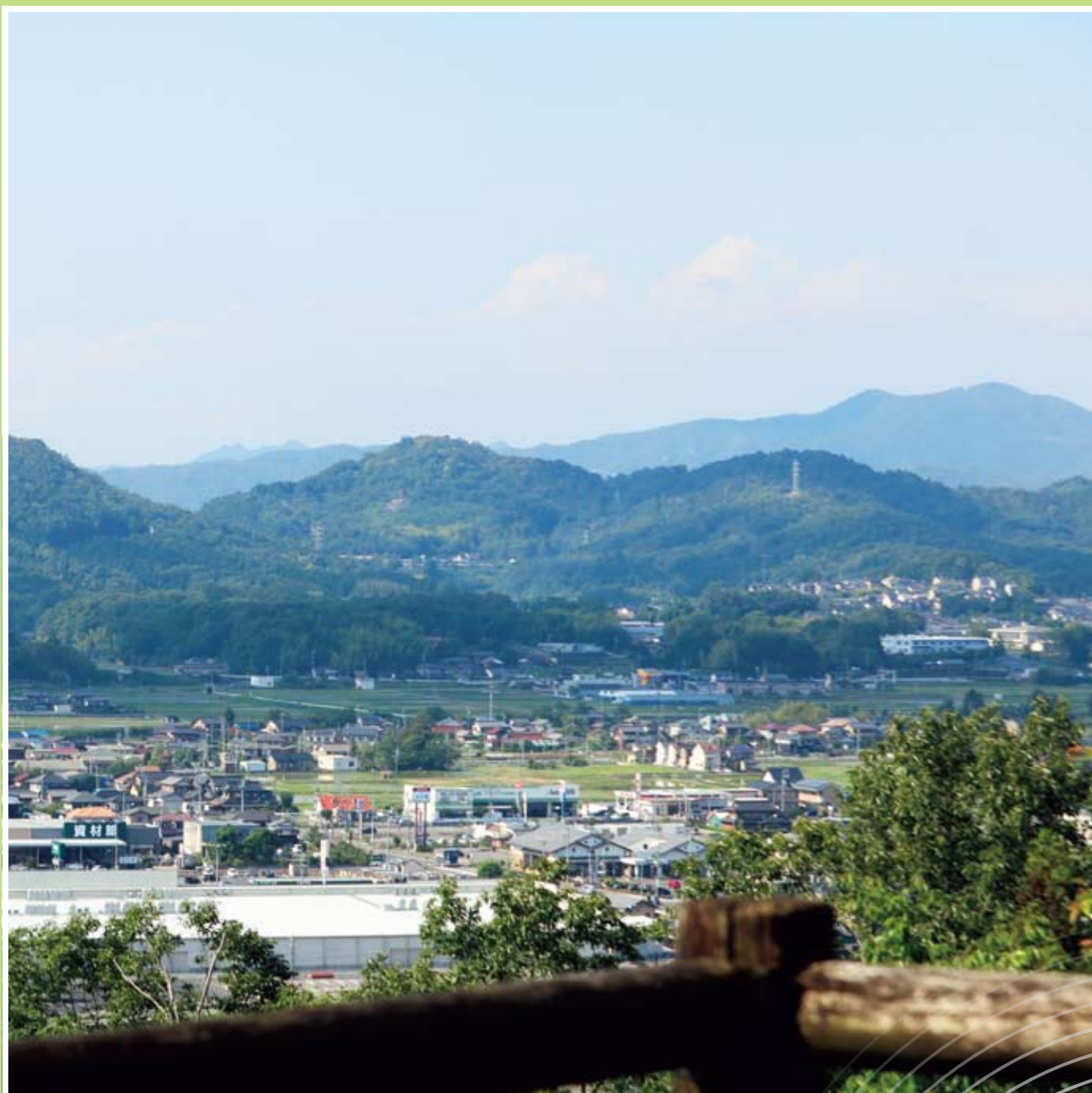
可児市 明智城跡・展望台からの眺望(明智荘)