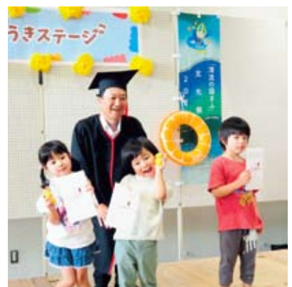
終了後に子供達と撮影会