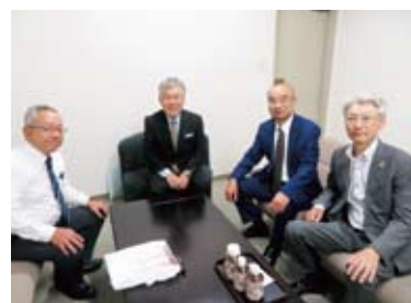
三宅先生と開始前楽屋にて