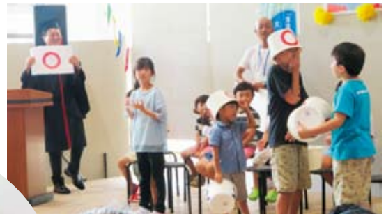
2位・3位決定戦(4位の子にごめんなさい)