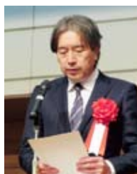
森 東濃県税事務所長 祝辞