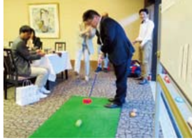
スナッグゴルフ大会の様子