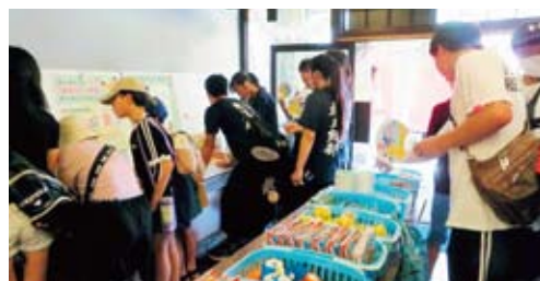
クイズ(パネルにヒント)

クイズに答えた後はボーリングゲームにチャレンジしてもらい、景品を渡してお祭り気分を盛り上げました。スタッフは瑞浪支部を中心に12名で、午前午後に分けて真夏の一日を乗り切りました。