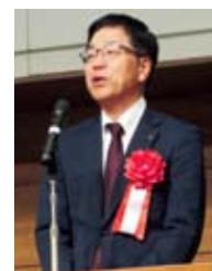
鈴木多治見副市長 祝辞