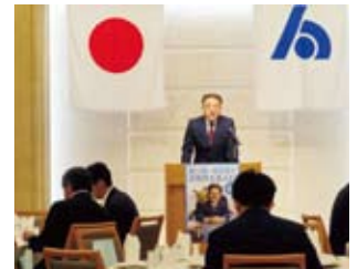
税務セミナー：岩田上席