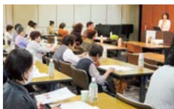
ミネラル講演会の様子