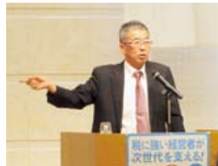
記念講演：黒柳署長