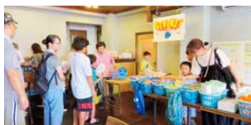
ボーリングゲームにチャレンジ