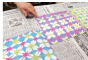
出来上がった折り染め