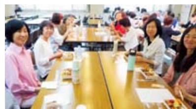
ミネラルオーガニック弁当の昼食会